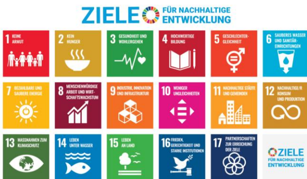
17 Ziele für nachhaltige Entwicklung der Vereinten Nationen

Nachhaltige Logistik- und Transportsysteme sind wichtig, um die Effizienz im Warenverkehr zu steigern und gleichzeitig Ressourcen zu schonen. Durch die Optimierung von Lieferketten und die Förderung von Recycling und Wiederverwendung von Materialien können Unternehmen ihren ökologischen Fußabdruck verringern und einen verantwortungsvolleren Konsum fördern.