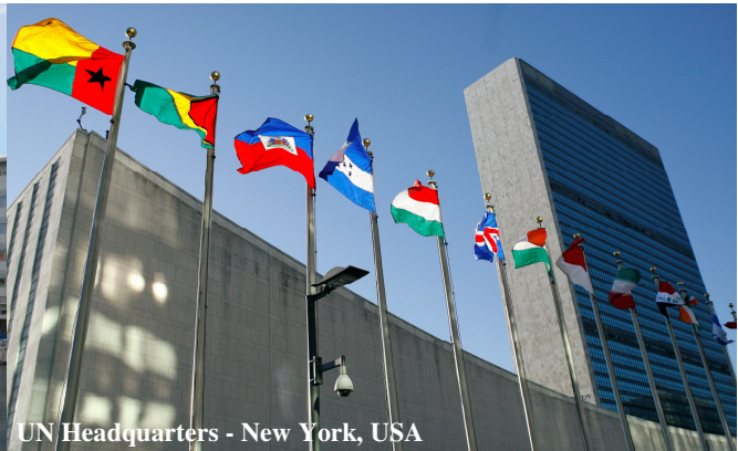
UN Headquarters - New York, USA