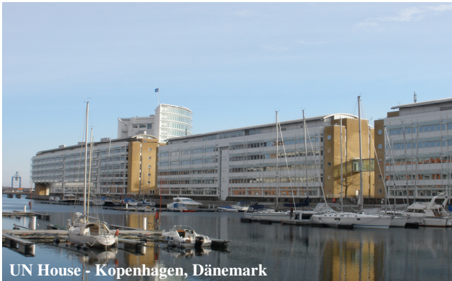
UN House - Kopenhagen, Dänemark